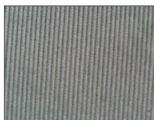
本クリーニング液でのクリーニング後